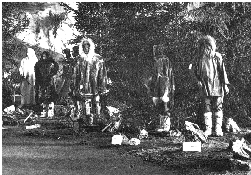
Рис. 6. Группа народов Севера на Антропологической выставке 1879 года

(рис. 6). Кроме того, в собрание вошли любопытные коллекции с островов Тихого океана и от жителей Северо-западного побережья Северной Америки – т.е. бывших Российских владений. Комиссия РГО старалась сосредоточить в организованном им собрании предметы серьезного научного интереса (рис. 7).