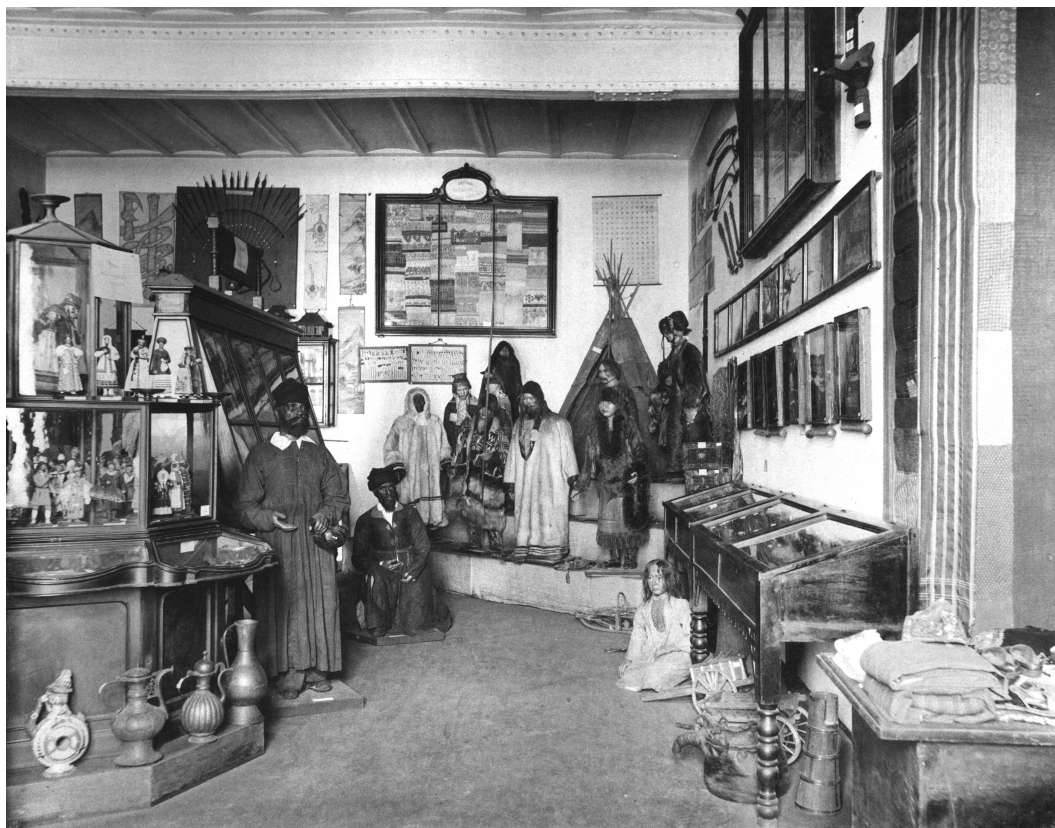
Рис. 4. Экспозиция из этнографических вещей Антропологической выставки 1879 года в Политехническом музее

форма креста, известная под названием свастика . Обратимся вновь к выступлению Е.В. Барсова на открытии выставки. «Крест этот есть ни что иное в своей основе, как два дерева, положенные поперек одно на другое: это форма , при посредстве которой человек впервые овладел огнем, которую сделал он затем символом солнца и его горящего огня; это та форма, которой и в настоящее время народ пользуется для добывания так называемого живого огня , от которого зажигает свою первую восковую свечу своим святым и праздникам. Ту же свастику можно встретить и на многих других предметах выставки, связанных с промыслами, где она вышивается и изображается как амулет счастья и успеха . Образ этой первобытной свастики в христианском сознании двоеверных народов слился с образом Христа» [Заседания ОЛЕАЭ... 1882].