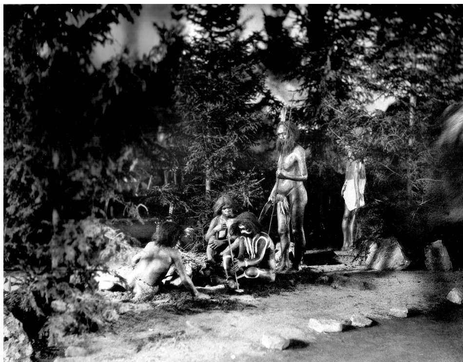
Рис. 8. Группа австралийцев на Антропологической выставке 1879 года