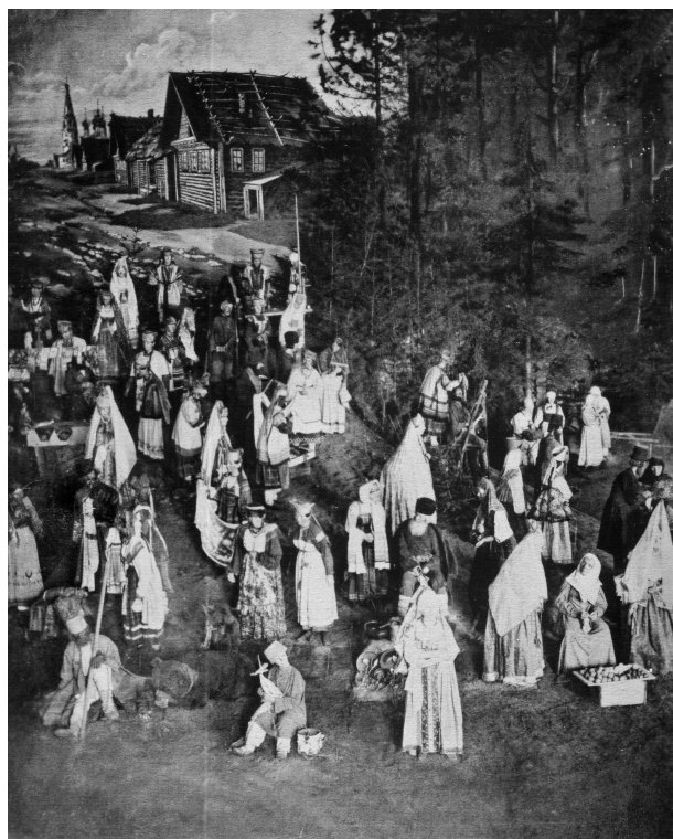
Рис. 1. Общий вид Этнографической выставки 1867 года

Тогда же было получено высочайшее разрешение на проведение Антропологической выставки. По сути, для того, чтобы этого добиться, ОЛЕАЭ