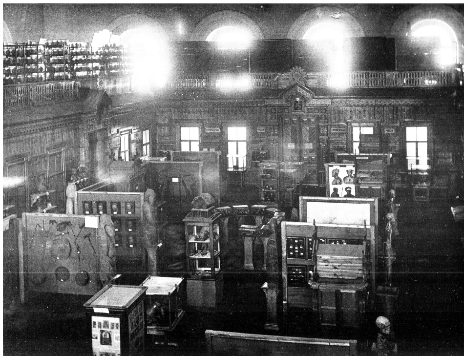
Рис. 7. Общий вид Экспонентского отдела на Антропологической выставке 1879 года